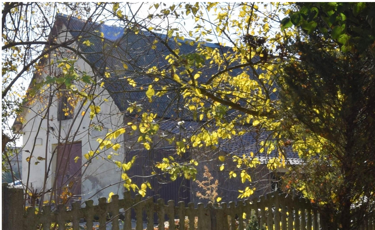
Widok od północy

8. Fotografia z opisem wskazującym orientację albo mapa z zaznaczonym stanowiskiem archeologicznym