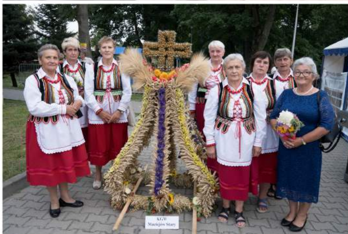
Urszula Kalińska oprac. na podstawie materiałów gromadzonych w GBP i informacji od przewodniczącej KGW

Kontynuując informację z wcześniejszych wydań Wysockiej Agencji Prasowej na temat historii Ochotniczych Straży Pożarnych działających na terenie Gminy Wysokie. Dziś przedstawiamy zarys dziejów kolejnych OSP.