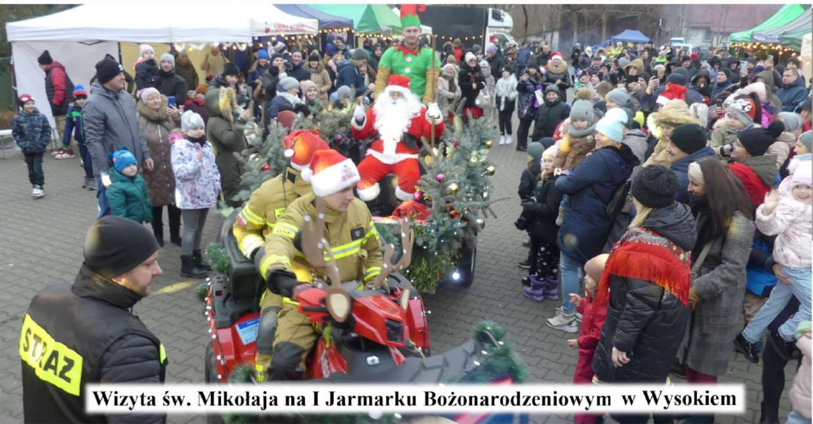
Wizyta św. Mikołaja na I Jarmarku Bożonarodzeniowym w Wysokiem