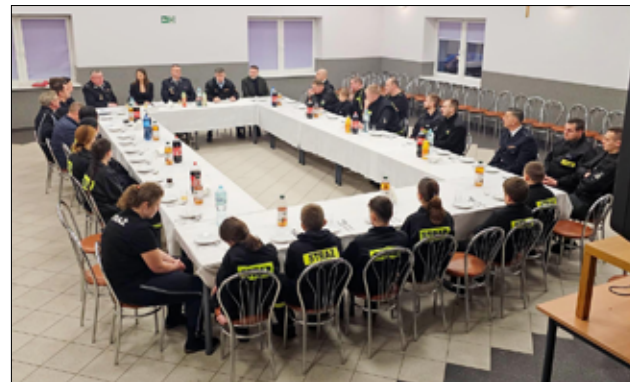
Podczas zebrania odczytane zostały sprawozdanie z działalności, sprawozdanie finansowe oraz sprawozdanie komisji rewizyjnej. Sprawozdanie ze swojej działalności przedstawili również członkowie MDP. Strażacy przedstawili także plan działalności na nowy rok.

– Akcje gaszenia pożarów, udział w działaniach ratowniczo-gaśniczych, usuwanie skutków licznych wichur, obsługa gminnych imprez kulturalnych – to tylko niektóre zadania, które w 2023r. wykonywali żarowscy strażacy – ochotnicy. Każda jednostka OSP przedstawiła sprawozdania ze swojej działalności oraz sprawozdania finansowe za miniony rok. Na zebraniach obecne były również Młodzieżowe Drużyny Pożarnicze, które od niedawna tak prężnie działają na terenie naszej gminy. Ponadto na zebraniu sprawozdawczym w Kalnie wybrano