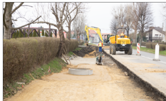
Nowe przejście dla pieszych oraz chodnik zlokalizowane będą przy ul. Armii Krajowej, od stacji paliw w kierunku Bożanowa.

Budowa bezpiecznych przejść dla pieszych to zadanie, które konse-