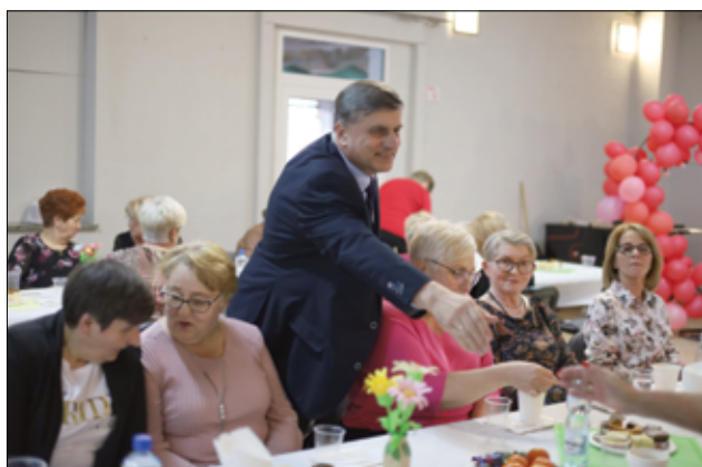
Moc życzeń, symboliczny kwiatek oraz słodkie upominki. Tak Dzień Kobiet świętowały Panie z Uniwersytetu Trzeciego Wieku w Żarowie.