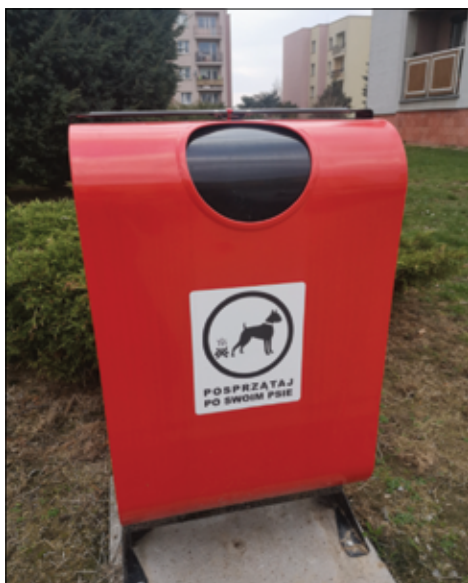
Sprzątnięcie odchodów po psach jest obowiązkowe, ale wciąż są osoby, które lekceważą przepisy zawarte w regulaminie utrzymania porządku i czystości.

Czy muszę sprzątać po swoim psie? Odpowiedzialny właściciel wie, że sprzątnięcie po swoim psie to nie dobra wola, ale obowiązek! Jego niewykonanie podlega karze w postaci mandatu. Sprzątnięcie po psie jest