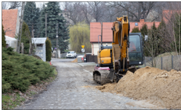
Zniszczony odcinek drogi przy ul. Polnej i Szkolnej w Łażanach już niebawem zyska nową nawierzchnię asfaltową.