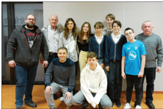
W wałbrzyskiej klasie okręgowej Goniec Żarów wystawił aż dwie drużyny.