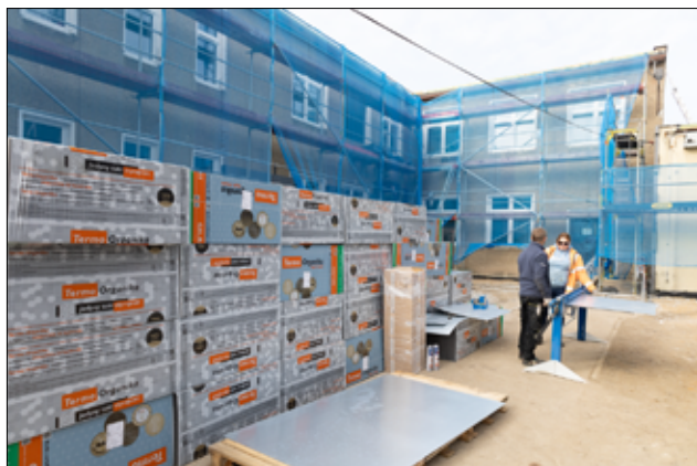
Za kilka miesięcy budynek SP Imbramowice będzie piękną wizytówką naszej gminy.

– Jesteśmy w trakcie II etapu termomodernizacji. W tej chwili prowadzone są prace związane z ociepleniem budynku