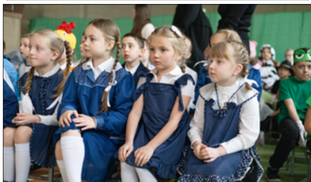
Uczniowie SP Żarów nie tylko świetnie przygotowali występ artystyczny, ale zadbali również o wystrój, dekoracje i odpowiednie stroje.