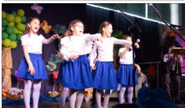
Wielkie gratulacje dla uczniów szkoły za fantastyczny występ artystyczny.