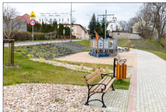
Cały teren stawu przeszedł rewitalizację, aby stać się miejscem jeszcze bardziej przyjaznym dla mieszkańców.