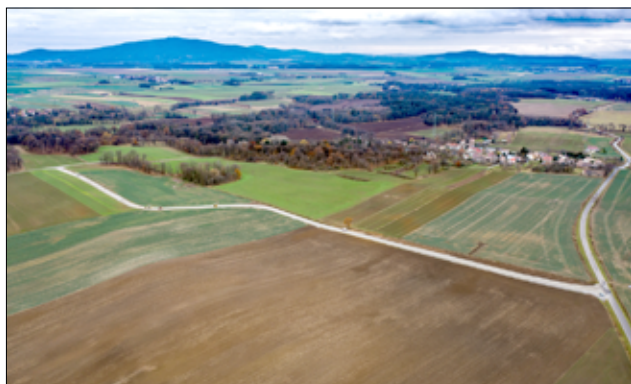
W pierwszym etapie inwestycji wykonana została warstwa konstrukcyjna drogi, co widać na zdjęciu.

– Zakres inwestycji to położenie asfaltu na tej drodze. Budowa obwodnicy Pożarzyska to jedna z najważniejszych inwestycji drogowych w naszej gminie, bo jej zadaniem jest wyprowadzenie trans-