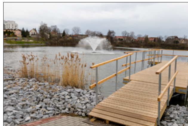
Pływająca fontanna, która została zamontowana nad stawem miejskim w Żarowie dodała uroku temu miejscu.

Przypomnijmy, że inwestycje nad stawem miejskim w Żarowie prowadzone były w ramach tego samego projektu, co modernizacja parku