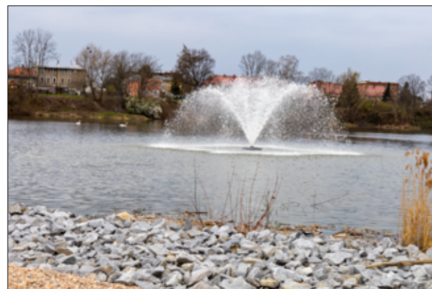
To kolejne miejsce w naszym mieście, do którego warto się wybrać.

„Rewitalizacja terenów zielonych na obszarze miasta Żarów”, na realizację którego gmina Żarów pozyskała 4.500.000 złotych dofinansowania z Programu Rządowego Fundusz Polski Ład: Program Inwestycji Strategicznych. Łączny koszt modernizacji stawu i parku miejskiego to kwota 5.261.053,10 złotych.