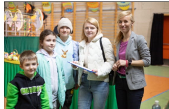
Wielkanocne konkursy tradycyjnie cieszyły się dużym zainteresowaniem, zarówno dzieci i młodzieży, jak i dorosłych mieszkańców naszej gminy.