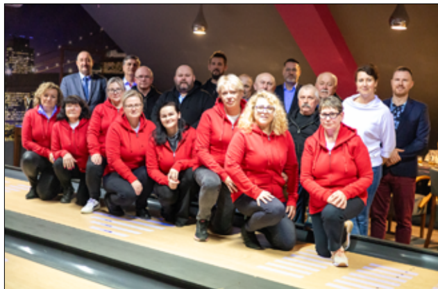
Sołtysi gminy Żarów na zdjęciu wraz z władzami oraz pracownikami UM Żarów.

Niespodzianką dla wszystkich sołtysów był Sołecki Turniej w kręgle, któremu, jak zawsze towarzyszyła dobra zabawa. Turniej wyłonił zwycięzców, choć nie o rywalizację tutaj chodziło, tylko o wspólną