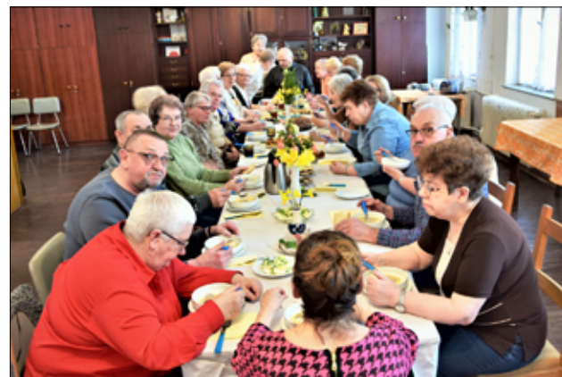
Tradycyjnie emeryci ze ZERiI w Żarowie spotykają się tuż przed świętami na wielkanocnym śniadaniu.

– Każdego roku emeryci spotykają się, aby wspólnie przy świątecznym stole złożyć sobie życzenia, podzielić się jajkiem i spędzić czas w gronie swoich przyjaciół. Wspólne życzenia i rozmowy przy świątecznym stole wprowadziły nas wszystkich w radosny, świąteczny nastrój. Dziękujemy wszystkim członkom naszego związku za udział