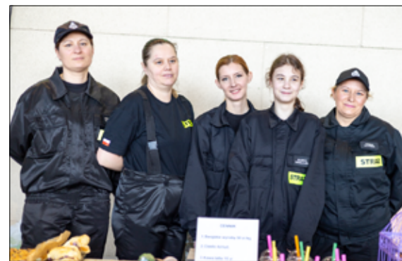
Na stoisku MDP Mrowiny można było nabyć nie tylko lokalne pyszności, ale także piękne i ręcznie wykonane wielkanocne dekoracje.