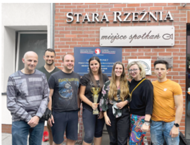
Gońiec Żarów ponownie w 2. lidze.

Przez dwa dni w Miliczu rozgrywana była 3. Dolnośląska Liga Seniorów, będąca turniejem o awans do rozgrywek wyższego szczebla. Na starcie zobaczyliśmy sześć drużyn. Rywalizowano systemem kołowym na dystansie 5. rund, tempem klasycznym 60' + 30". Rozgrywki zakończyły się zwycięstwem Gońca Żarów, który wspólnie z drużyną Parnas Oława uzyskał awans do rozgrywek centralnych. Nadmienić trzeba, iż żarowianie nie doznali żadnej porażki, odnosząc trzy zwycięstwa i dwa remisy.