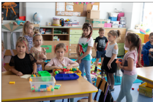
Dzieci uczą się w komfortowych warunkach. Sale lekcyjne są wyremontowane i odświeżone. Odremontowane wnętrza to też nowa jakość nauki.