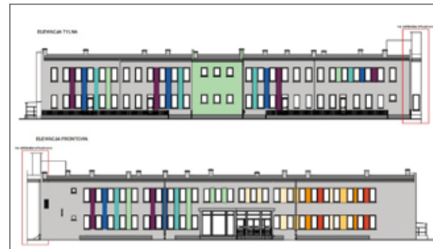
Zakres inwestycji jest bardzo duży, dlatego będzie to kolejna duża inwestycja oświatowa na terenie naszego miasta.

W ramach inwestycji planowana jest wymiana stolarki okiennej i drzwiowej, ocieplenie stropodachu oraz ścian, wymiana instalacji centralnego ogrzewania na ogrzewanie podłogowe, (wraz z montażem pompy ciepła), instalacji elektrycznych w całym budynku oraz montaż klimatyzatorów w salach. Zadanie