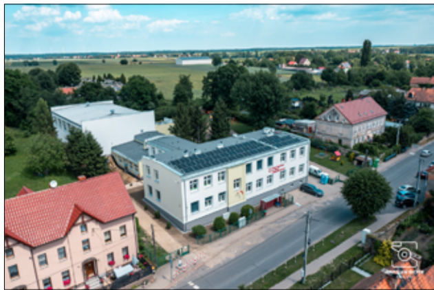
Zmiany widać jak na dłoni. Szkoła jest piękną wizytówką gminy Żarów.

– Zakończył się II etap prac przy termomodernizacji budynku Szkoły Podstawowej im. UNICEF w Imbramowicach. Inwestycja swoim zakresem obejmowała nie tylko samą termomodernizację, ale przy okazji tego zadania wyremontowaliśmy również całą placówkę. Szkoła wygląda teraz jak nowa. Wymieniliśmy