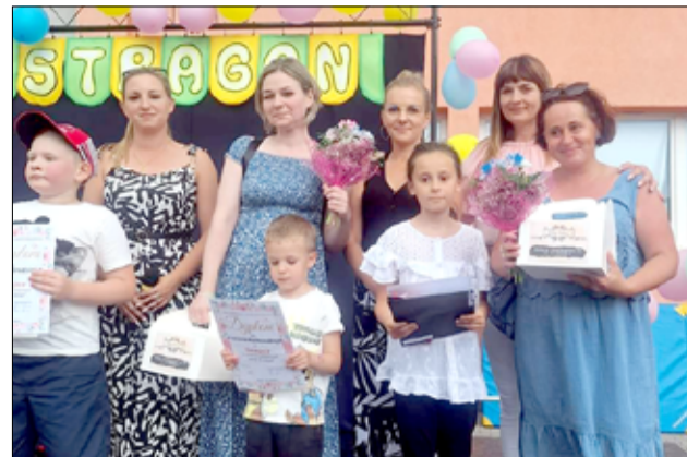
Na zdjęciu laureaci konkursu „Laurka dla Mamy” wraz z dyrektorką oraz nauczycielkami szkoły.

Z okazji Dnia Matki Szkoła Podstawowa im. Jana Brzechwy w Żarowie już po raz czwarty zorganizowała konkurs plastyczny na najpiękniejszą laurkę dla swojej Mamy.