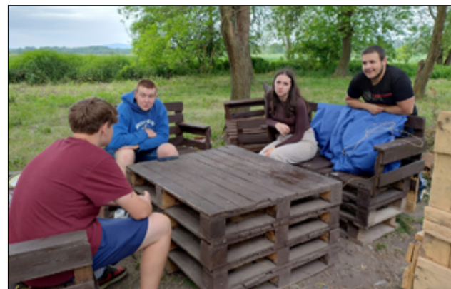
Efekty można podziwiać gołym okiem. Strefa relaksu „Pod Chmurką” w Przyłęgowie.

– Pomysł na stworzenie takiej strefy relaksu na świeżym powietrzu to od samego początku projekt naszej młodzieży z Przyłęgowa. Jestem pod wielkim wrażeniem ich kreatywności i cieszę się, że udało im się stworzyć estetyczny zakątek na terenie naszej wsi. Tutaj mogą czuć się swobodnie i spędzać ze sobą swój wolny czas. A trzeba przyznać, że zaskoczyli rękawki i mocno wzięli się do pracy. Przez kilka dni zbijali siedziska i stoliki, a później je malowali i zabezpieczali przed wilgocią. Bardzo dziękuję mieszkańcom wsi za dostarczenie palet i innych mebli ogrodowych, z których powstała strefa relaksu „Pod chmurką”. Wielkie podziękowania i gratulacje należą się również młodzieży za