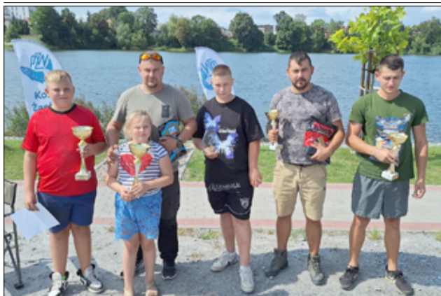
Laureaci Fedderowych Mistrzostw Koła.

Po raz trzeci PZW koło Żarów zaprosiło wędkarzy do rywalizacji o Fedderowe mistrzostwa koła.