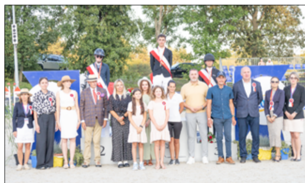
Podobnie jak w minionym roku, gmina Żarów była partnerem tego wydarzenia.

zacje tak niesamowitego przedsięwzięcia. To była wspaniała impreza i wspaniała promocja gminy Żarów.