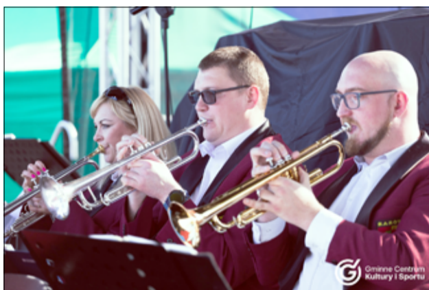
Żarowska Orkiestra Dęta zapisała się na kartach historii miasta i gminy Żarów.