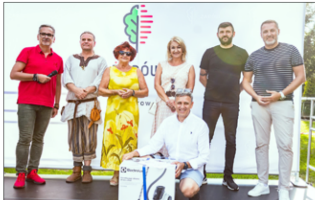
Na zdjęciu laureaci konkursu „Chlebowzięci” wraz z organizatorami wydarzenia. Fundatorem nagród w konkursie była firma Electrolux Żarów.

Festiwal Mąki w Siedlimowicach, którego organizatorem jest Gminne Centrum Kultury i Sportu, ponownie przyciągnął tłumy.