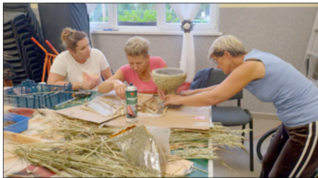
Tradycja przygotowywania wieńców dożynkowych jest podtrzymywana od lat przez panie z Kół Gospodyń Wiejskich.