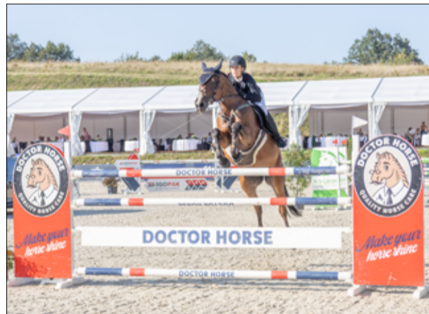
Podczas zawodów można było podziwiać zmagania utalentowanych jeźdźców.

Ośrodek jeździecki Biały Las w Wierzbnej to nie tylko arena sportowych zmagania, ale to także szkoła i akademia jeździecka. Od kilku lat na terenie ośrodka odbywają się Mistrzostwa Polski w skokach przez przeszkody. Wielkie brawa należą się gospodarzom za organi-