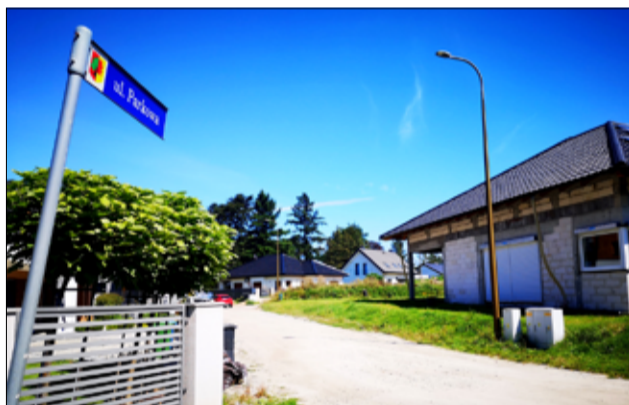
Droga przy ul. Parkowej w Żarowie już niebawem zostanie wyremontowana.

– Prawie 100 szt. nowych słupów oświetleniowych zostanie zamontowanych na terenie miasta i gminy Żarów. Sukcesywnie montujemy oświetlenie uliczne w miejscach, gdzie jeszcze go nie ma oraz uzupełniamy i wymieniamy w miejscach, gdzie jest taka konieczność. Dodatkowo w trzecim kwartale tego roku chcemy wyłonić