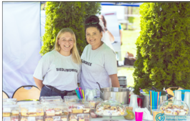
Na Festiwalu Mąki nie zabrakło także stoisk ze słodkimi przystawkami przygotowanymi przez naszych mieszkańców.