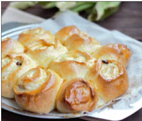
Takie pyszności będzie można kosztować na dożynkach gminnych w Wierzbnej.

Warunkiem udziału w konkursie jest złożenie karty zgłoszeniowej do konkursu do dnia 2 września 2024 r. w siedzibie Urzędu Miejskiego w Żarowie, ul. Zamkowa 2, Żarów, w godzinach pracy Urzędu, którą można pobrać ze strony internetowej www.um.zarow.pl lub z Biura Obsługi Klienta Urzędu Miejskiego w Żarowie. Komisja konkursowa pod uwagę będzie brała walory smakowe, pomysłowość w zdobnictwie, prezentację oraz este-