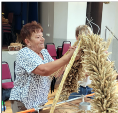
Już dziś gratulujemy naszym paniom pomysłowości i kreatywności.

nagrodzone i na dożynkach rozstrzygniemy konkurs na „Najpiękniejszy wieniec dożynkowy”. Tymczasem dziękujemy mieszkańcom, którzy angażują się w pracę przy organizacji gminnych dożynek.