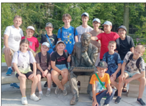
Uczestnicy obozu szachowego w Polanicy-Zdrój.

Oprócz rywalizacji w Festiwalu Szachowym uczestnicy obozu mieli zapewnione wiele innych ciekawych atrakcji. Udział w obozie szachowym został wsparty finansowo przez gminę Żarów w ramach realizacji zadania publicznego