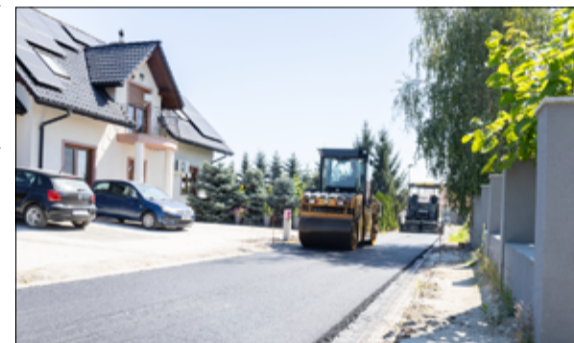
Mieszkańcy ul. Bocznej w Mrowinach dojadą już do swoich domów nową, wyremontowaną drogą.

Całkowity koszt przebudowy dróg przy ul. Bukowej, Wierzbowej i Jodłowej w Żarowie to kwota 4 360 025,92 złotych. Jest to kolejna inwestycja, na