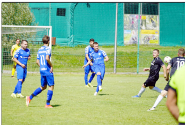
Piłkarze KS Zjednoczeni rozpoczynają nowy sezon.

Wystartowała wałbrzyska okręgówka z udziałem Zjednoczonych Żarów.