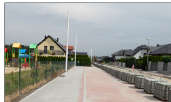
Prace drogowe na osiedlu domków jednorodzinnych w Żarowie również zakończą się w tym roku.

którą Gmina Żarów pozyskała dofinansowanie z Programu Inwestycji Strategicznych Rządowy Fundusz Polski Ład. Kwota przyznanego dofinansowania wynosi 4.142.024,62 złotych. Z kolei remont drogi przy ul. Bocznej w Mrowinach kosztował 437.377,47 złotych. Na realizację tego zadania gmina Żarów również pozyskała dofinansowanie z programu Fundusz Ochrony Gruntów Rolnych Województwa Dolnośląskiego w wysokości 156.000 złotych.