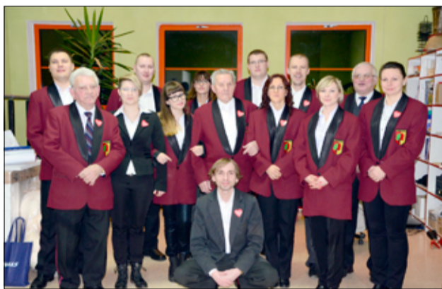
Tak jak kiedyś, tak i dziś muzycy uświetniają swoimi występami wiele wydarzeń w gminie Żarów.

► Jaki jest wasz repertuar? Czy uświetniacie swoimi występami różne wydarzenia gminne?