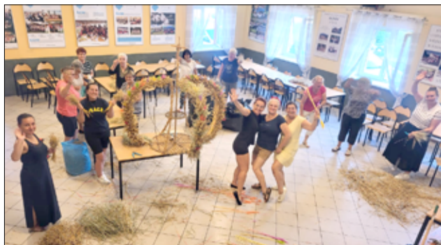
Wszystkie ręce na pokład! Nasze gospodynie z KGW przygotowują się do obchodów gminnych dożynek w Wierzbnej.

Takie dożynkowe wieńce przygotowują najczęściej panie z Kół Gospodyń Wiejskich. To niezwykle konstrukcje, w które panie wkładają ogrom pracy. Jak podkreślają gospodynie z gminy Żarów, technika tworzenia takiego wieńca jest przekazywana z pokolenia na pokolenie i jest przepiękną tradycją, z której możemy być dumni, ponieważ są to prawdziwe dzieła sztuki. Wspólną pracę Pań będziemy mogli podziwiać podczas dożynek gminnych w Wierzbnej. Najpiękniejsze wieńce dożynkowe tradycyjnie zostaną również