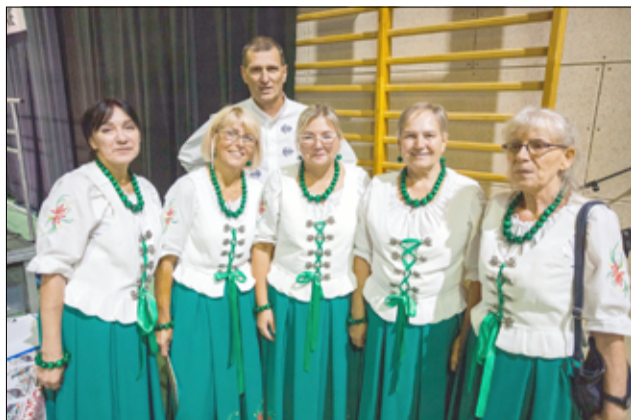
W repertuarze Krukowian królują znane covery, ale sami również są autorami wielu utworów. Prywatnie są dla siebie oparciem i pomagają sobie nawzajem w różnych życiowych sytuacjach.

– Jubileusz 10-lecia zespołu Krukowanie już za nami. To było naprawdę udane muzyczne spotkanie w gronie zaprzyjaźnionych zespołów, zaproszonych gości oraz licznie przybyłych sympatyków „Krukowian”. Spotkanie utrzymane było w konwencji koncertu, w trakcie którego na scenie zaprezen-