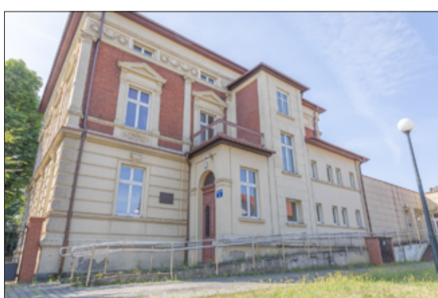
Na końcowe efekty przebudowy budynku trzeba będzie poczekać, ale dzięki podpisanej umowie rozpoczną się pierwsze prace inwestycyjne w tym miejscu.