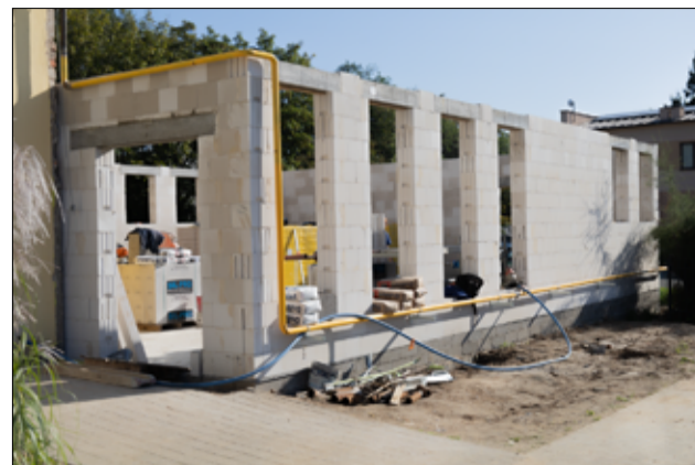
Prace przy realizacji tej inwestycji prowadzone są zgodnie z harmonogramem.

Po zakończeniu zadania, rozpoczniemy kolejny etap prac na terenie tego obiektu. Budynek Bajkowego Przedszkola doczeka się termomodernizacji, w ramach której ocieplony zostanie cały obiekt, wymienione będą okna i oświetlenie, zainstalowane będą instalacje sanitarne oraz elektryczne, nastąpi również zmiana źródła ciepła. Ogłoszenie