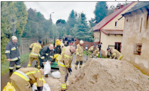
Strażacy ochotnicy – na nich zawsze można liczyć. Pracowali bezinteresownie na rzecz naszej społeczności, zawsze na miejscu, gdy była taka potrzeba.

–Skutki niszczycielskiego żywiołu usuwane są również na terenie naszej gminy. Działania naszych jednostek ochrony przeciwpożarowej koncentrowały się przede wszystkim na budowie zabezpieczeń przeciwpowodziowych z worków z piaskiem, udrażnianiu spływu wody oraz usuwaniu zatorów na rzekach. Strażacy odpompo-