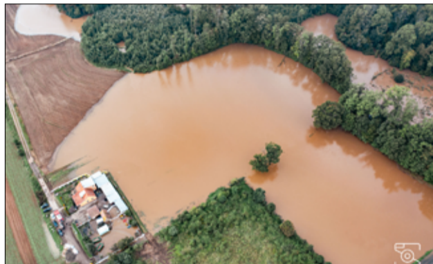
Zdjęcie wykonane z lotu ptaka, na którym widać niszczycielską skalę żywiołu, który nawiedził naszą gminę.

–W ostatnich dniach mieszkańcy gminy Żarów po raz kolejny pokazali, że potrafią zjednoczyć się i wspólnie działać na rzecz drugiego człowieka. Siła naszej społeczności nie tkwi tylko w liczbach i słowach, ale przede wszystkim w sercach i czynach. Bardzo dziękuję mieszkańcom, strażakom, pracownikom Urzędu, członkom Sztabu Kryzysowego i wszystkim, którzy byli zaangażowani i służyli swoim wsparciem w trudnym czasie powodzi, która dotknęła naszą społeczność. Dzięki Państwa szybkiej reakcji, niezłomnej pracy i ogromnej determinacji udało się uratować wiele domów, dobytku, a przede wszystkim – zdrowie i życie