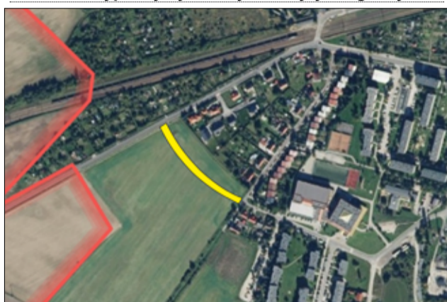
Na terenie Żarowa powstanie kolejna droga, pomiędzy ul. Wiejską a Górnicy.

organizacji ruchu, o czym będziemy Państwa informować – wyjaśnia burmistrz Przemysław Sikora.