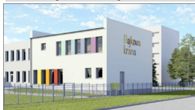
Wizualizacja nowego obiektu, który powstaje przy budynku Żłobka Miejskiego „Bajkowa Kraina” w Żarowie.

przetargu na termomodernizację Bajkowego Przedszkola w Żarowie planowane jest jeszcze w tym roku. Gmina pozyskała już dofinansowanie na realizację tego zadania w wysokości 5.388.788,78 złotych z Programu Operacyjnego Fundusze Europejskie dla Dolnego Śląska 2021-2027. Termomodernizacja przedszkola będzie realizowana w ramach zadania „Renowacja zwiększająca efektywność energetyczną budynku przedszkola w Żarowie” w 2025 roku. Całkowity koszt rozbudowy Żłobka Miejskiego „Bajkowa Kraina” w Żarowie wynosi 1.589 037,00 zł., przyznane dofinansowanie z programu Krajowy Plan Odbudowy to kwota 502.068 złotych.