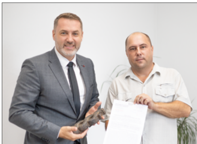
Oficjalnie części mostu z Łażan zostały wpisane do rejestru zabytków. To efekt współpracy UM Żarów z Politechniką Opolską oraz Żarowską Izbą Historyczną.

– Ukończony został kolejny etap projektu pn. „Renowacja i ekspozycja elementów żeliwnego mostu łukowego w Łażanach przez rzekę Strzegomkę”, mam tutaj oczywiście na myśli wpisanie zachowanych elementów tego mostu do tzw. rejestru zabytków ruchomych przez Dolnośląskiego Wojewódzkiego Konserwatora Zabytków. Jest to rezultat współpracy Urzędu Miejskiego w Żarowie, Politechniki Opolskiej oraz Żarowskiej Izby Historycznej działającej w ramach Gminnego Centrum Kultury i Sportu w Żarowie. Wspomniane elementy uznane zostały pełnoprawnie za zabytek techniki, z czego osobiście bardzo się cieszę. Jest to kolejne i niezbędne ogniwo na drodze do zamierzonego celu. Przed nami etap kolejny, czyli wstępne zabezpieczenie konserwacyjne zgodnie z wytycznymi WUOZ oraz pozyskanie zewnętrznych środków finansowych na renowację i ekspozycję tego wyjątko-