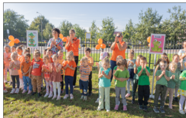
Z okazji Ogólnopolskiego Dnia Przedszkolaka odwiedziliśmy Bajkowe Przedszkole w Żarowie, aby złożyć wszystkim dzieciom życzenia.

– Tradycyjnie Bajkowe Przedszkole w Żarowie włączyło się w obchody Ogólnopolskiego Dnia Przedszkolaka. W naszym przedszkolu jest radośnie i kolorowo. Śpiewamy, bawimy się, bo nasze przedszkolaki to super dzieciaki. Podczas dzisiejszego święta nie zabrakło życzeń, a także gromkiego sto lat dla naszych dzieci. Dużą niespodzianką przygotowaną przez pracowników placówki było także puszczanie kolorowych balonów do nieba. Wszystko