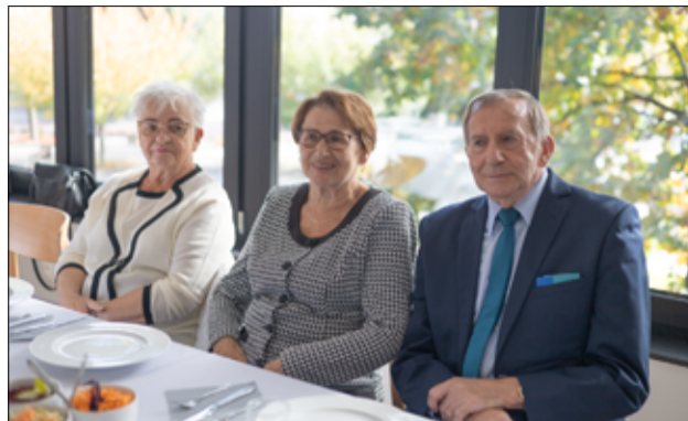
Spotkanie emerytowanych nauczycieli było również dobrą okazją, aby zasiąść przy wspólnym stole, złożyć sobie życzenia, porozmawiać i wspólnie się zintegrować.

– Świętując Dzień Edukacji Narodowej jeszcze bardziej uświadamiamy sobie, że praca nauczyciela to coś więcej niż tylko godziny spędzone przy tablicy. To dzięki Państwa pasji młodzi ludzie mają możliwość odkrywania swoich talentów, zdobywania wiedzy i uczenia się wartości, które będą im towarzyszyć przez całe życie. Życzę, aby każdy dzień przynosił Państwu wiele satysfakcji,