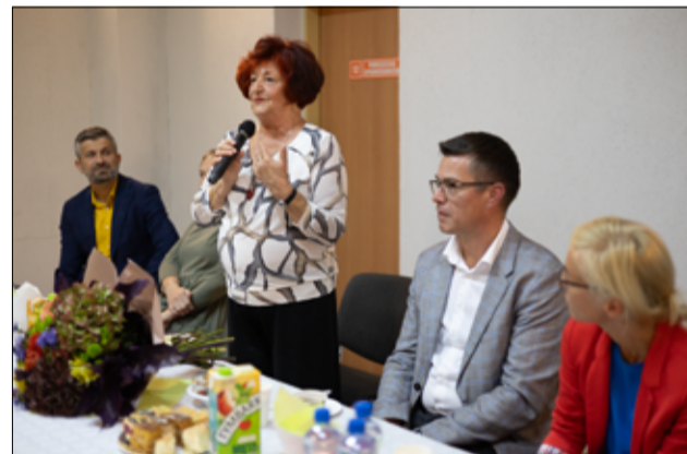
Wspólnie spędzony czas w miłym towarzystwie, relaks i zdobywanie nowych umiejętności – na to wszystko mogą liczyć studenci UTW Żarów.