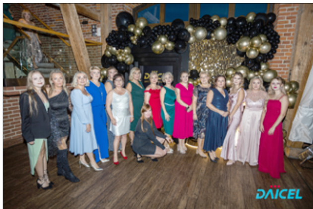
W jubileuszowej gali uczestniczyli zaproszeni goście oraz wszyscy pracownicy firmy DSSE w Żarowie.

produkty bezpieczeństwa dla przemysłu motoryzacyjnego w Europie, zapewniając kierowcom i pasażerom ochronę na każdym etapie podróży. „Daicel – niewidzialny bohater każdej podróży” – to hasło, które odzwierciedla naszą misję. Choć nasze rozwiązania są niewidoczne dla oka, każdego dnia odgrywają kluczową rolę w ratowaniu życia i zwiększaniu bezpieczeństwa na drogach. Po 20 latach dynamicznego rozwoju z optymizmem patrzymy w przyszłość, stawiając na dalsze inwestycje w nowoczesne technologie, zrównoważony rozwój oraz wzmocnienie naszej pozycji na globalnym rynku motoryzacyjnym. Serdecznie dziękujemy