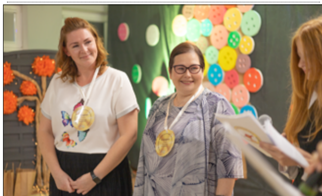
Świętowaliśmy także Dzień Nauczyciela, którzy w podziękowaniu za swoje poświęcenie i zaangażowanie otrzymali od uczniów pamiątkowe medale.

i nauczycielom. Niech czas spędzony w murach szkoły będzie piękną przygodą, a nawiązane przyjaźnie zostaną w Waszym życiu na zawsze.