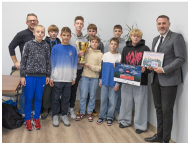
Burmistrz pogratulował zawodnikom oraz trenerowi zdobycia tak wielkiego sukcesu.

– Mamy zdolnych piłkarzy w naszej gminie. Nasi młodzi piłkarze reprezentujący gminę zdobyli 3. miejsce w Finałach Wojewódzkich Turnieju „Z orlika na stadion”. To wspaniałe osiągnięcie, pokazuje Wasz talent, determinację i sportowego ducha walki. Dziękuję zawodnikom za niesamowite emocje, trenerowi za ciężką pracę i wsparcie oraz wszystkim, którzy trzymali za Was