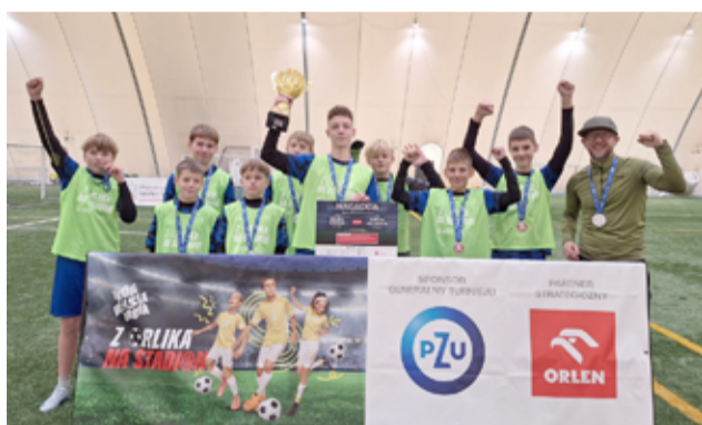
Zwycięska drużyna z SP Żarów.

kciuki! To dopiero początek – wierzę, że przed Wami jeszcze wiele sukcesów. Gratulacje dla całej drużyny – mówił podczas spotkania z młodzieżą burmistrz Przemysław Sikora.