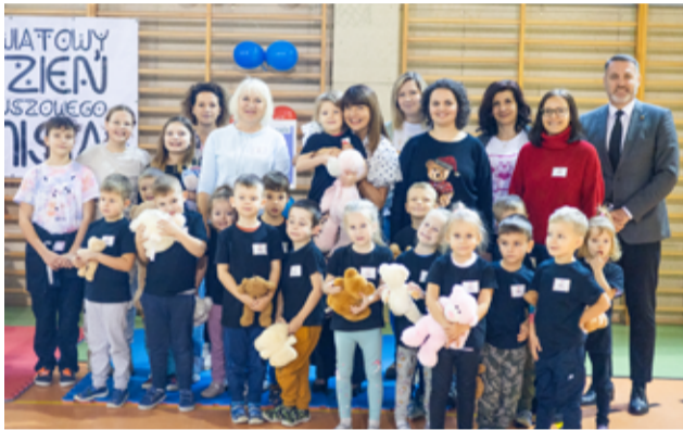
Małych zawodników oklaskiwali również zaproszeni goście.