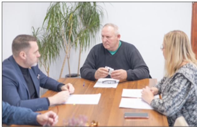
Dzięki pozyskaniu przez gminę Żarów dofinansowania już niebawem stare lampy zostaną wymienione na nowe i energooszczędne.

– Prace przy wymianie opraw oświetleniowych rozpoczną się początkiem 2025 roku i będzie to kolejna ważna inwestycja na terenie naszej gminy. Stare lampy sodowe zostaną zastąpione nowoczesnymi i energooszczędnymi oprawami LED. Dzięki temu gmina Żarów oraz mieszkańcy zyskają lepszą jakość oświetlenia – jaśniejsze i bardziej naturalne światło, niższe koszty utrzymania – LED-y zużywają znacznie mniej energii niż tradycyjne lampy sodowe, większe bezpieczeństwo – lepsze oświetlenie ulic i przestrzeni publicznych, ochronę środowiska – zmniejszenie emisji CO2 i mniejsze zużycie energii. To krok w stronę nowoczesnej, ekologicznej infrastruktury, który przyniesie korzyści wszystkim