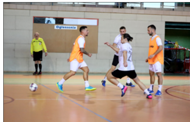
O tytuł mistrzowski walczy 12. drużyn.