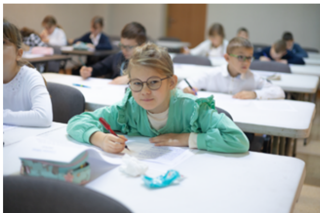
Podczas konkursu uczestnicy mocno się skupiali, aby ich praca była jak najlepsza.

– W dobie tabletek i urządzeń elektronicznych sztuka kaligrafii i umiejętność ładnego pisania to ogromna wartość. Dziś zazwyczaj skupiamy się na krótkich wiadomościach tekstowych, które nie zawsze napisane są poprawnie ortograficznie i składniowo. Opanowanie sztuki kaligrafii, czyli „ładnego pisma” jest dużą wartością i bardzo się cieszę, że konkurs cieszył się tak dużym powodzeniem – mówiła zastępca dyrektora