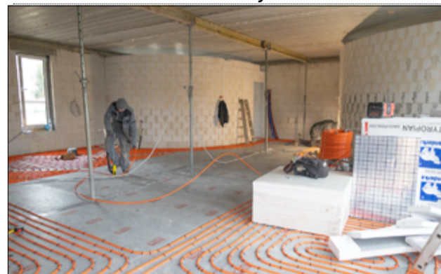
Prace postępują z dnia na dzień, ale na końcowe efekty trzeba jeszcze trochę poczekać.

Całkowity koszt rozbudowy Żłobka Miejskiego „Bajkowa Kraina” w Żarowie wynosi 1.589.037,00 złotych. Na realizację tego zadania gmina Żarów pozyskała dofinansowanie z programu Krajowy Plan Odbudowy.