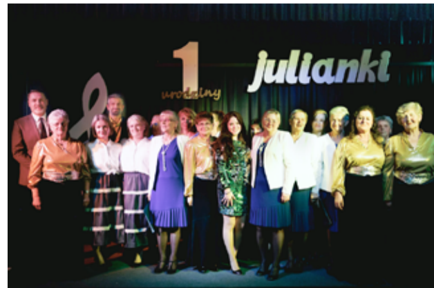
To był piękny jubileusz zespołu Julianki. Na zdjęciu członkinie zespołu wraz z zaproszonymi gośćmi.

– Macie za sobą występy na licznych przeglądach zespołów śpiewaczych i jesteście „ozdobą” wielu uroczystości, które odbywają się na terenie gminy Żarów. Cieszę się i jednocześnie dziękuję za pasję i emocje, które zawsze towarzyszą