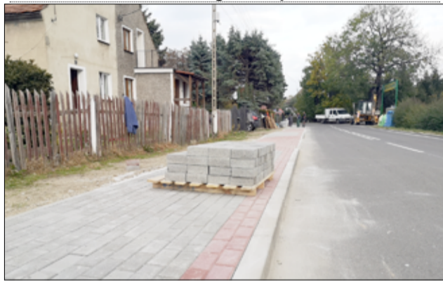
Do użytku mieszkańców w tym roku oddane zostaną kolejne kilometry nowych chodników.

mieszkańcom naszej gminy – mówi burmistrz Przemysław Sikora.