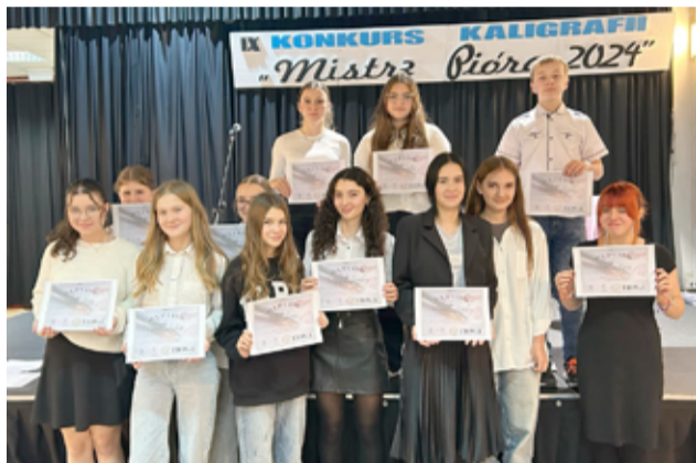
Wszyscy otrzymali dyplomy udziału w konkursie „Mistrz Pióra 2024”.