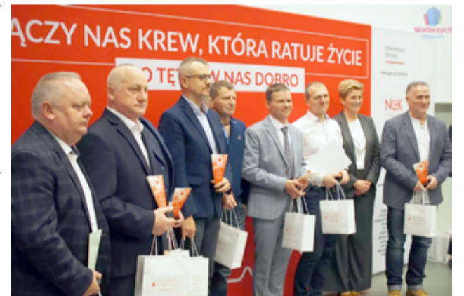
Krwiodawcy z Żarowa zostali po raz kolejny docenieni i odznaczeni.

Oprac. Magdalena Pawlik na podstawie informacji z Klubu Honorowych Dawców Krwi w Żarowie