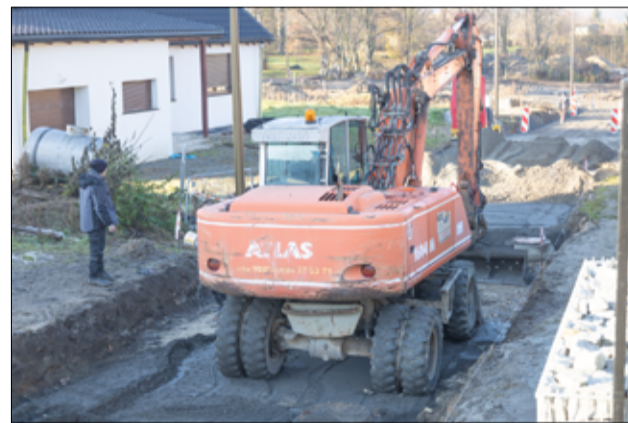
Trwają prace przy budowie nowej drogi na ul. Parkowej w Żarowie. To kolejna inwestycja, długo wyczekiwana przez naszych mieszkańców.

– Budowa drogi przy ul. Parkowej w Żarowie to kolejna inwestycja drogowa, która jest realizowana na terenie naszego miasta. Prace nie są uciążliwe, a wykonawca inwestycji prowadzi roboty zgodnie z podpisanym harmonogramem. W ramach tego zadania wykonamy kanalizację deszczową, a w kolejnym etapie droga zostanie zmodernizowana i zyska nową nawierzchnię asfaltową – mówi kierownik Referatu Inwestycji Urzędu