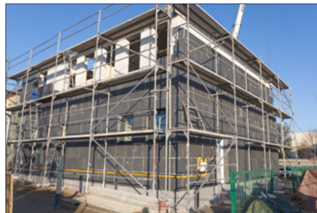
W nowym budynku, który powstaje przy Żłobku Miejskim w Żarowie, znajdzie się miejsce dla kolejnej grupy żłobkowej.

– Rozbudowa Żłobka Miejskiego „Bajkowa Kraina” w Żarowie to jedna z najważniejszych inwestycji oświatowych, która prowadzona jest na terenie naszego miasta. Jesteśmy w stałym kontakcie z wykonawcą inwestycji i nadzorujemy realizowane prace. Przypomnę, że w ramach inwestycji budynek żłobka zostanie rozbudowany o salę wielofunkcyjną i grupę żłobkową, co oznacza, że powstaną nowe miejsca dla naszych najmłodszych mieszkańców. Docelowo mają tutaj powstać dwa pomieszczenia, jedno dla grupy żłobkowej, a drugie będzie to sala spotkań z przeznaczeniem na organizację różnych wydarzeń przedszkolnych i żłobkowych. Wszystko z myślą o naszych najmłodszych mieszkańcach – mówi burmistrz Przemysław Sikora.