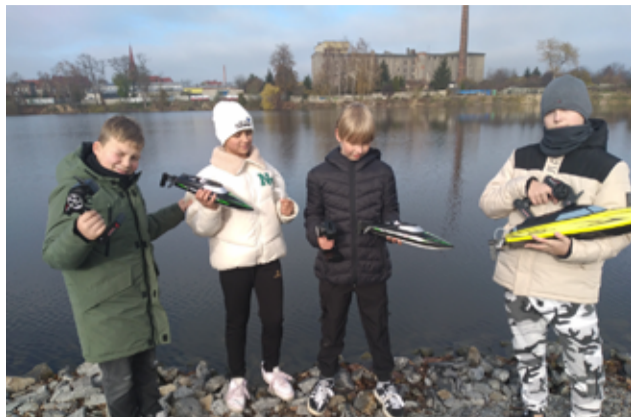
Na zdjęciu nagrodzeni modelarze z modelarni „Harcek” w Żarowie.

– W związku z udziałem naszego klubu w programie MSiT „Klub 2024”