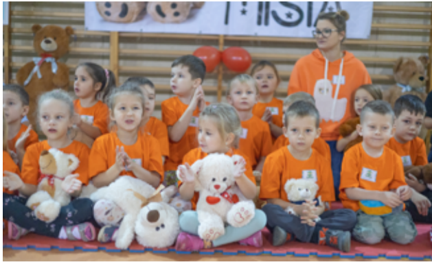
Z okazji Dnia Pluszowego Misia na hali sportowej GCKiS w Żarowie odbył się turniej sportowy przedszkolaków.

– Kto z nas nie miał w dzieciństwie swojego ukochanego pluszowego misia? 25 listopada swoje święto obchodził najlepszy przyjaciel maluchów. O Dniu Pluszowego Misia pamię-