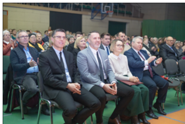
Wśród gości, którzy uczestniczyli na spotkaniu noworocznym nie zabrakło także radnych Rady Miejskiej, sołtysów, przedstawiciele służb mundurowych i wielu naszych organizacji.