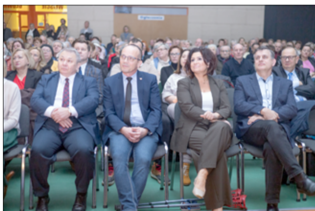
Spotkanie noworoczne rozpoczęło się od podsumowania 2024 roku, w formie materiału filmowego, który został zaprezentowany wszystkim uczestnikom wydarzenia.