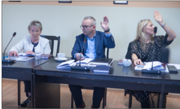
Radni Rady Miejskiej jednogłośnie przyjęli projekt uchwały w sprawie uchwalenia budżetu gminy Żarów na 2025 rok.