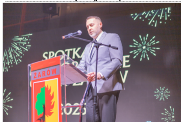
Burmistrz Miasta Żarów podczas spotkania noworocznego omówił plany na 2025 rok.