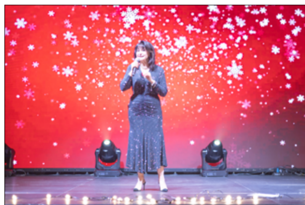
To był fantastyczny koncert. Krystyna Giżowska zaśpiewała w Żarowie swoje największe hity.

wymienił m.in. termomodernizację Przedszkola Miejskiego w Żarowie, budowę ścieżki rowerowej z Żarowa do Wierzbnej, rewitalizację budynków mieszkalnych wspólnot mieszkaniowych, budowę budynku wielofunkcyjnego na potrzeby świetlicy wiejskiej w Pożarzysku i wiele innych zadań.