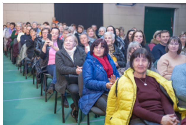
Cieszymy się, że byliście Państwo z nami. Trudno było znaleźć wolne miejsce na hali GCKiS, gdzie odbywało się spotkanie.