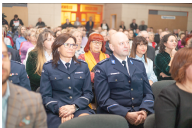
Wśród gości na spotkaniu noworocznym nie zabrakło także przedstawiciele służb mundurowych.