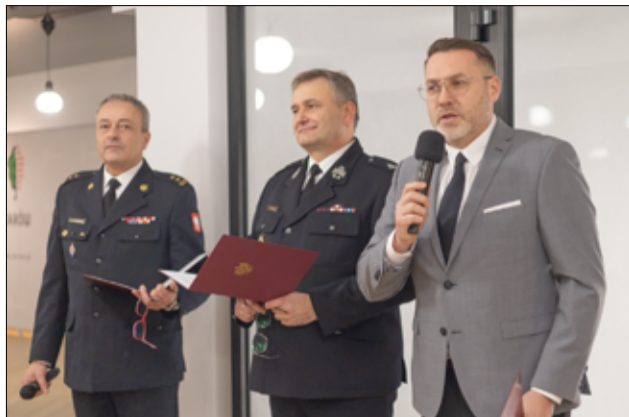
Strażakom za rok trudnej i szlachetnej służby dziękowali także zaproszeni goście.

Spotkanie było także okazją, aby podsumować działalność Państwowej Straży Pożarnej oraz Ochotniczych Straż Pożarnych działających na terenie powiatu