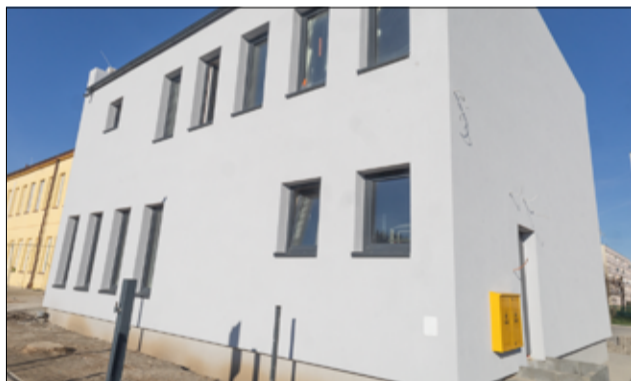
W nowym budynku Żłobka Miejskiego znajdzie się miejsce dla kolejnej grupy żłobkowej.

Całkowity koszt rozbudowy Żłobka Miejskiego „Bajkowa Kraina” w Żarowie wynosi 1.819.483,67 zł. Po zakończeniu prac przy rozbudowie Żłobka Miejskiego podpisana zostanie umowa z wykonawcą inwestycji na termomodernizację budynku