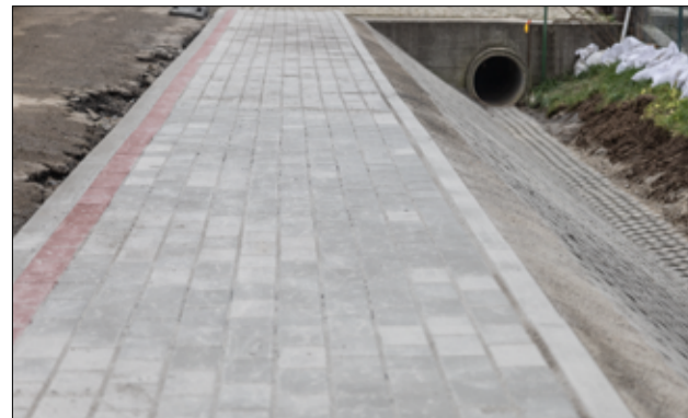
Nowe chodniki to duże ułatwienie dla mieszkańców i znacząca poprawa bezpieczeństwa pieszych.