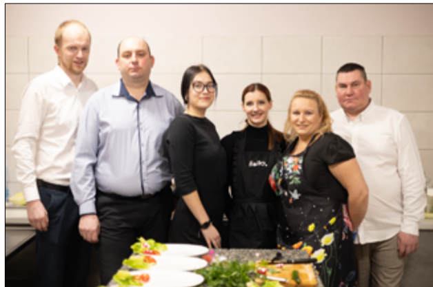
O pyszny poczęstunek dla gości zadbała Rada Sołecka Mrowin.