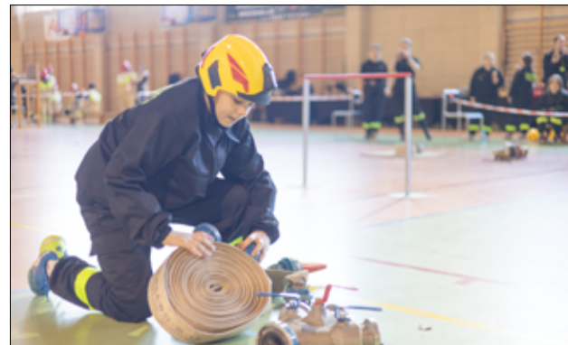
Zawody sportowo-pożarnicze to doskonała okazja do popularyzacji działalności strażaków, a także świetna zabawa i nauka dla młodzieży.

Kategoria drużyn chłopców: I MDP Wierzbna I, II MDP Wierzbna II, III Drużyna MDP Mrowiny (II drużyna), IV Imbramowice Nr 3, V Błyskawica Kalno, VI MDP Wierzbna 4, VII OSP Żarów, VIII Imbramowice Nr 2, IX Drużyna MDP Mrowiny (I drużyna).