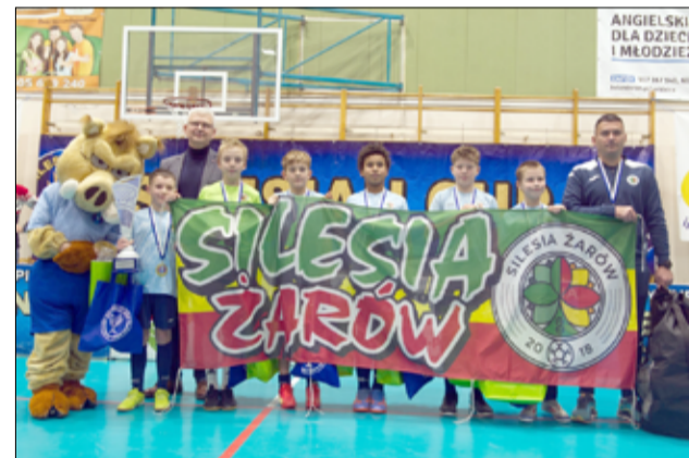
Silesia Żarów ponownie najlepsza podczas Silesian Winter Cup!

Dwa lata temu triumfowali w kategorii do lat dziecięcych. Dziś wygrywają jako jedenastolatki. Żarowianie od początku turnieju prezentowali się bardzo dobrze. Fazę grupową zakończyli ze znakomitym bilansem goli 21:1. Zdarzył im się jednak nieco słabszy moment i przegrany pojedynek 0:1 z MKS-em Gogolin. Drużyna z Opolszczyzny wygrała grupę B, a młodzi mieszkańcy naszego miasta awansowali do półfinału z drugiej lokaty. W drugiej grupie najlepszy okazał się z kolei Górnik Nowe Miasto Wałbrzych, wyprzedzając Margol Sława. Półfinały były niesłychanie zacięte, a o losach obu musiały zdecydować dopiero rzuty karne. W starciu Silesii z Górnikiem Nowe Miasto w regulaminowym czasie gry padł bezbramkowy remis. Karne lepiej wykonywali żarowianie, wygrywając 2:1. W drugim półfinale Margol Sława zremisował 2:2 z MKS-em Gogolin, zwyciężając następnie po emocjonującej serii jedenastek (2:1). W decydującej potyczce Silesia Żarów ograła Margol w regulaminowym