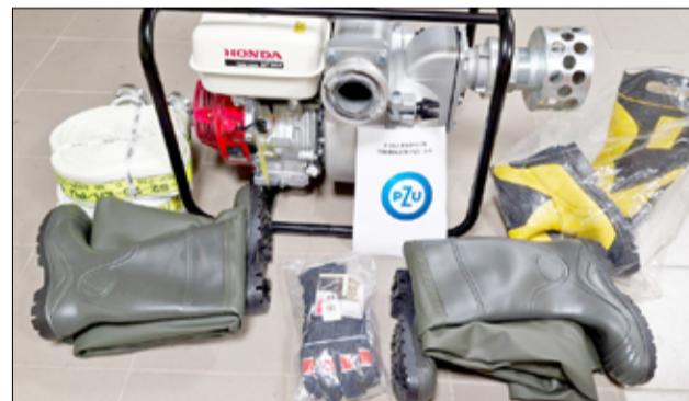
Nowy sprzęt pozwoli naszym strażakom jeszcze skuteczniej nieść pomoc potrzebującym.

– W 2024r. Ochotnicza Straż Pożarna w Żarowie złożyła wniosek do PZU S.A. z siedzibą w Warszawie o wsparcie finansowe na zadanie prewencyjne, mające na celu ograniczenie występowania szkód powstałych podczas powodzi 2024r. polegające na zakupie sprzętu niezbędnego do działań ratowniczych podejmowanych przez Ochotniczą Straż Pożarną w Żarowie. Zakup artykułów umożliwi naszym