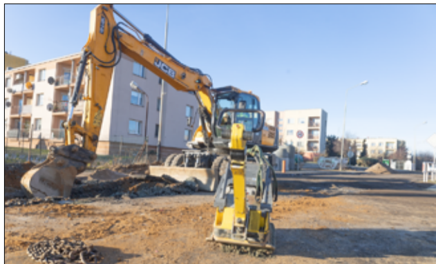
Prace przy realizacji tej inwestycji rozpoczęły się pod koniec 2024r. W tej chwili realizowany jest pierwszy etap tego zadania.

– Zakres inwestycji jest bardzo duży, dlatego prace, jak już Państwa wcześniej informowaliśmy, realizowane będą etapami. Przy ul. Piastowskiej w Żarowie, w ramach realizowanego zadania, przebudowana zostanie nawierzchnia drogi i wykonamy nowe miejsca parkingowe. Utrudnienia drogowe, które występują przy ul. Piastowskiej w Żarowie, związane są z wykonaniem dodatkowego bypassu sieci wodociągowej. Uniemożliwia to