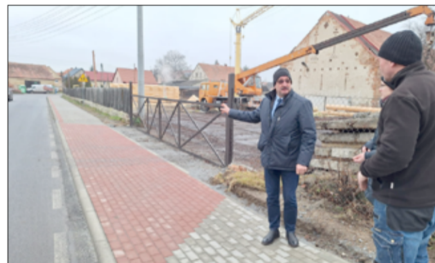
Inwestycje zostały odebrane w obecności pracowników UM Żarów oraz radnych Rady Miejskiej i sołtysów wsi.

ważne zadania, które zostały przeprowadzone na terenach wiejskich. Nie tylko poprawiły estetykę, ale również mają istotny wpływ na poprawę bezpieczeństwa. W planach inwestycyjnych na 2025 rok jest budowa chodników na terenie kolejnych miejscowości w gminie Żarów. Powstaną one zarówno przy drogach gminnych, jak i powiatowych.