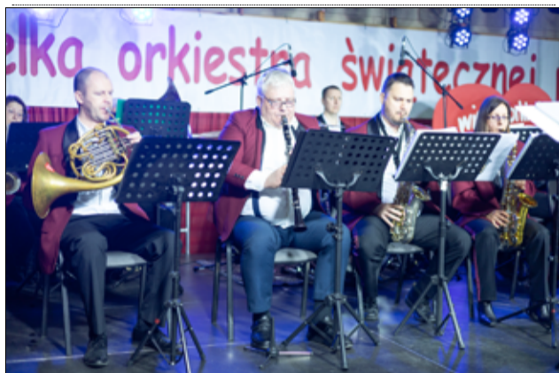
Tradycyjnie w GCKiS zaprezentowali się także muzycy z Żarowskiej Orkiestry Dętej.