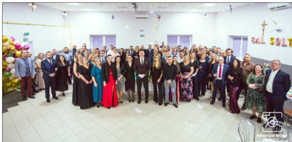
Bal Sołtysa to impreza, gdzie spotykają się sołtysi i przedstawiciele Rad Sołeckich, wspólnie dziękując sobie za kolejny rok i całoroczną pracę na rzecz mieszkańców wsi.

– Dziękujemy wszystkim za przybycie. Na naszej świetlicy wiejskiej w Mrowinach gościmy dziś sołtysów wsi oraz