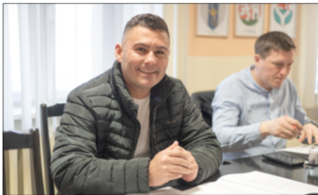
Pieniądze, które trafiły do klubów sportowych, mogą być przeznaczone m.in. na realizację programów szkolenia sportowego, zakup potrzebnego sprzętu, czy pokrycie kosztów organizowania zawodów sportowych.