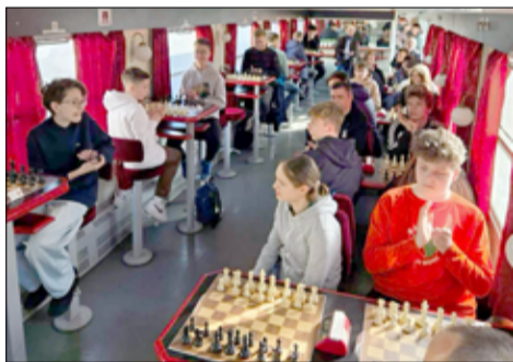
W nietypowej scenarii starych pociągów rywalizowali młodzi szachiści Gońca Żarów. Zawody rozegrano w Muzeum Kolejnictwa na Śląsku w Jaworzynie Śl.