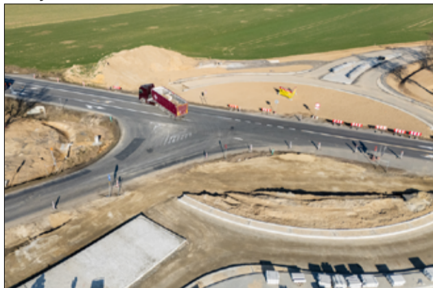
Wprowadzona na czas budowy ronda tymczasowa organizacja ruchu nie wprowadziła żadnych utrudnień komunikacyjnych.