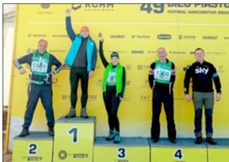
Nieoficjalna klasyfikacja żarowskich biegaczy na dyst. 25 km

W finałowym weekendzie, 7-9 marca, zostały rozegrane główne biegi na 25, 30 i 50 kilometrów. Na każdym dystansie zobaczyliśmy żarowian, a łącznie w tych trzech biegach wystar-