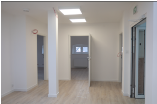
W ramach prac m.in. odświeżono i wyremontowano także pokoje na poddaszu budynku.

W następnym etapie, zgodnie z oczekiwaniami naszych mieszkańców, w budynku