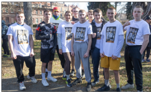
Wśród uczestników biegu nie zabrakło także dzieci i młodzieży. Na zdjęciu wychowankowie MOW w Mrowinach wraz z opiekunami.

W związku z wydarzeniem Żarowska Izba Historyczna przygotowała także wystawę plenerową podczas której można było zobaczyć pokaźny zbiór militariów oraz żołnierskiego ekwi-