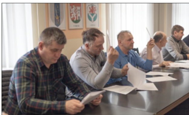
Członkowie spółki jednogłośnie zatwierdzili sprawozdanie zarządu i przyjęli plan robót na 2025 rok.

– Ogółem zgromadzony budżet spółki w roku ubiegłym wyniósł 248.565,69 złotych. Wsparciem dla działalności spółki wodnej były dotacje, które otrzymaliśmy z budżetu gminy Żarów w wysokości 20.000,00 zł. i Dolnośląskiego Urzędu Wojewódzkiego w kwocie 47.000,00 złotych. Kwota 57.344,44 zł. pozostała jako środki na rachunku bankowym z 2023 r. Dysponując pozyskanymi środkami finansowymi wykonaliśmy konserwację rowów, w tym gruntowną konserwację przy użyciu sprzętu ciężkiego na długości 8.245,00 metrów bieżących i renowację sieci drenażowej na powierzchni 4,22 ha. Trzeba jednak pamiętać, że jest to niewielki procent stanu ewidencyjnego szczegółowych urządzeń melioracyjnych znajdujących się na terenie naszej gminy. Dziękujemy za wsparcie, pomoc oraz ścisłą współpracę w zakresie spraw związanych z naszą działalnością statutową burmistrzowi