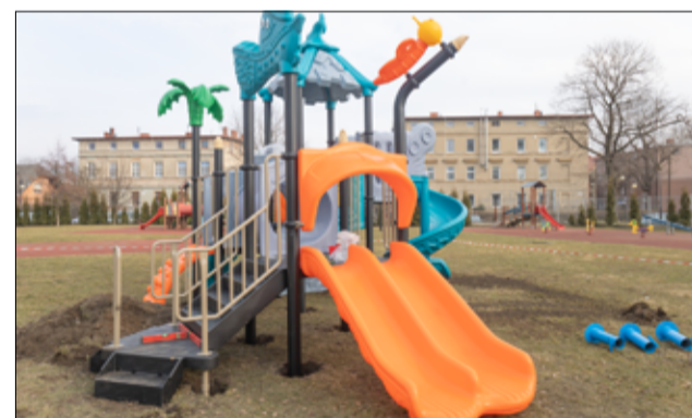
Nowy plac zabaw dla dzieci jest kolorowy, nowoczesny, a przede wszystkim bezpieczny.

Przy szkolnej placówce zamontowany został nowy plac zabaw. Do użytku najmłodszych oddano nowe urządzenia zabawowe, w tym huśtawka pozioma, kopuła wspinaczkowa, ściana wspinaczkowa, mata przedmiotowa i inne kolorowe elementy. Wszystkie urządzenia posiadają wymagane atesty i certyfikaty.