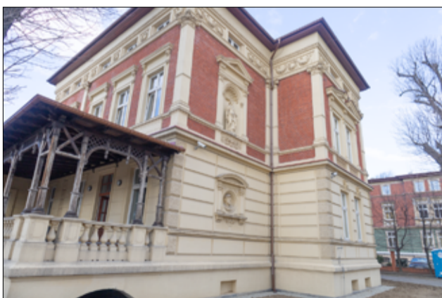
Odbiór techniczny budynku odbył się w obecności burmistrzów, pracowników UM Żarów oraz wykonawcy inwestycji.

powstanie nowoczesna i reprezentacyjna sala ślubów. W planach jest także przeniesienie do budynku Urzędu Stanu Cywilnego i Ewidencji Ludności oraz niektórych referatów, zwłaszcza tych, które obsługują najwięcej mieszkańców. Na realizację trzeciego etapu prac gmina będzie starać się o pozyskanie kolejnego dofinansowania.