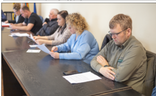
Od lat dbają o stan rowów melioracyjnych w gminie. Pozyskują środki, czyszczą, udrażniają, a nawet odtwarzają na nowo.