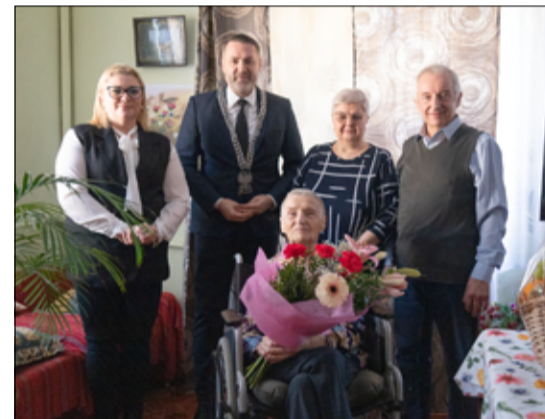
Podczas spotkania pani Józefa chętnie dzieliła się swoimi wspomnieniami z lat, a uśmiech nie schodził z jej twarzy.