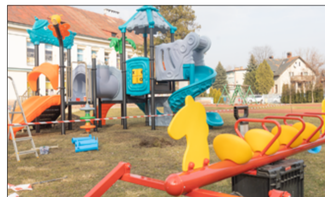
Z nowego placu zabaw będą mogli korzystać uczniowie zerówek i oddziałów przedszkolnych SP Żarów.

– To kolejne miejsce, które będzie służyć dzieciom, zapewniając im bezpieczną i radosną przestrzeń do zabawy. Cieszymy się, że możemy wspierać rozwój i radość dzieci w naszej gminie – mówi zastępca burmistrza Kamil Nieradka.